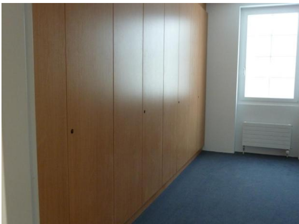
Die Bibliothek steht kurz vor der Vollendung mit Wandschränken und vorverlegtem Teppich.