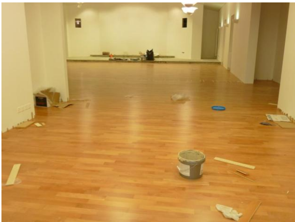
Blick Richtung Kapelle und Podium.