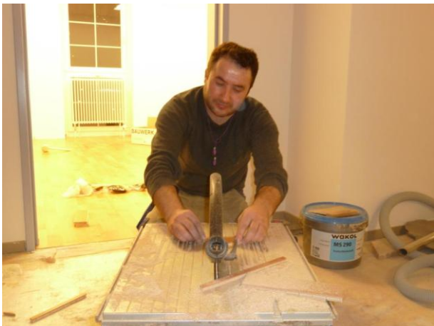
Zuschneidearbeiten der einzelnen Paneelen.