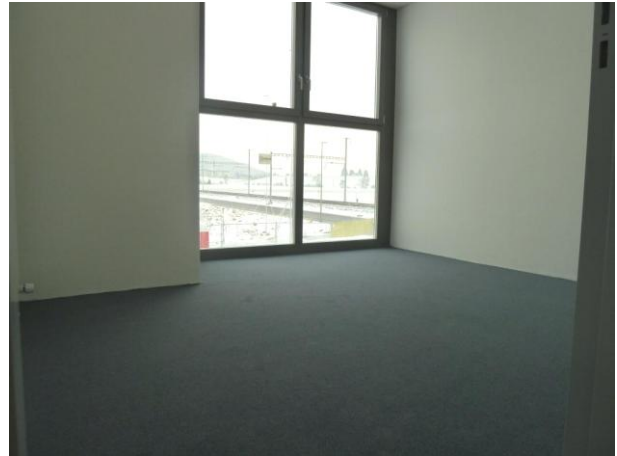
Auch im Gruppenraum 7 ist der Teppich vorverlegt.