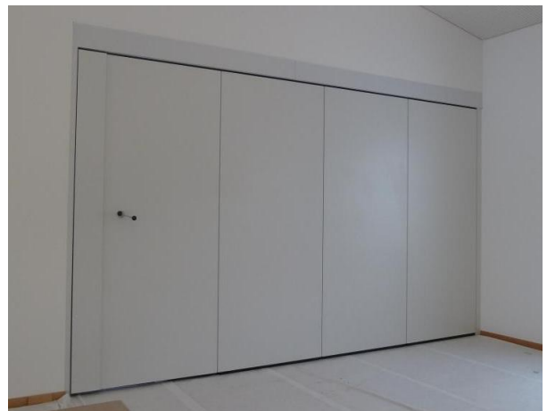
Und hier im OG, im Bereich der Kapelle...