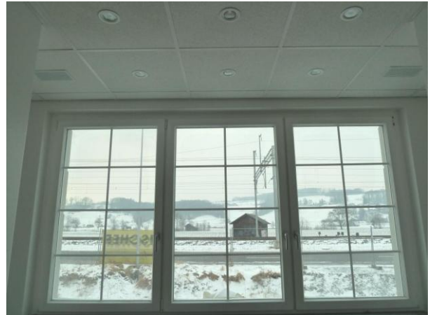
10. Februar 2012: Die Decke über dem Taufbecken ist fertiggestellt; Blick aus dem dortigen Fenster auf die verschneite Landschaft.