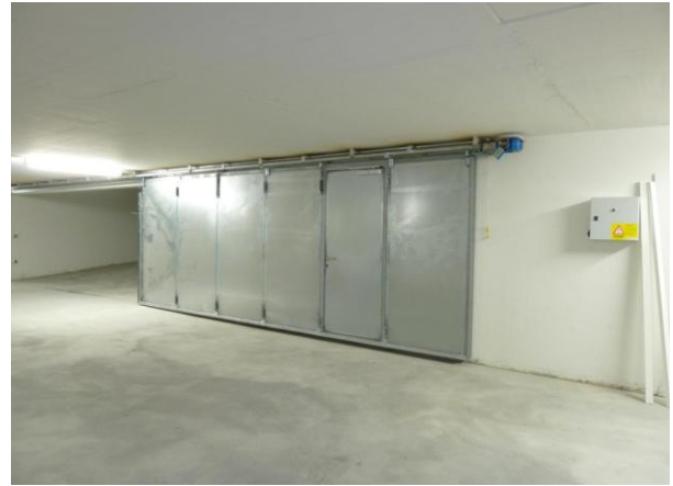
Auch das Garagentor ist montiert worden.