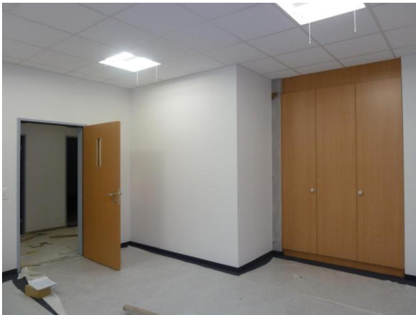
Schrankpartie im Gruppenraum 5 (Kindergarten)...