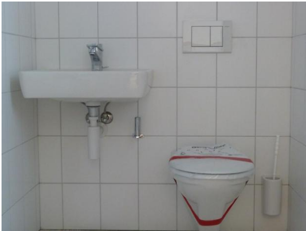
Auch die Sanitärapparate in den verschiedenen Nasszellen sind montiert.