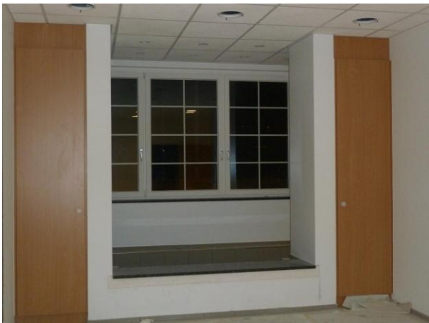
... und beim Taufbecken.