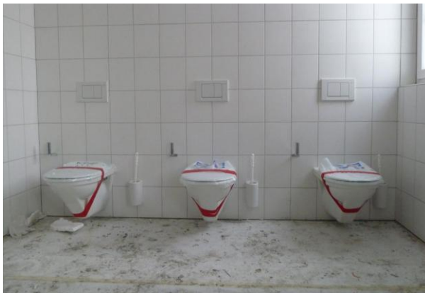
Der Sanitär hat die Apparate vorsichtshalber gut sichtbar zugeklebt, da die Kanalisation noch nicht funktioniert.