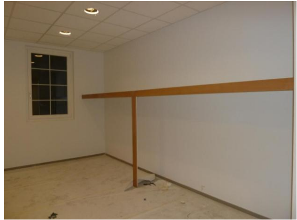
Eine der beiden Garderoben.