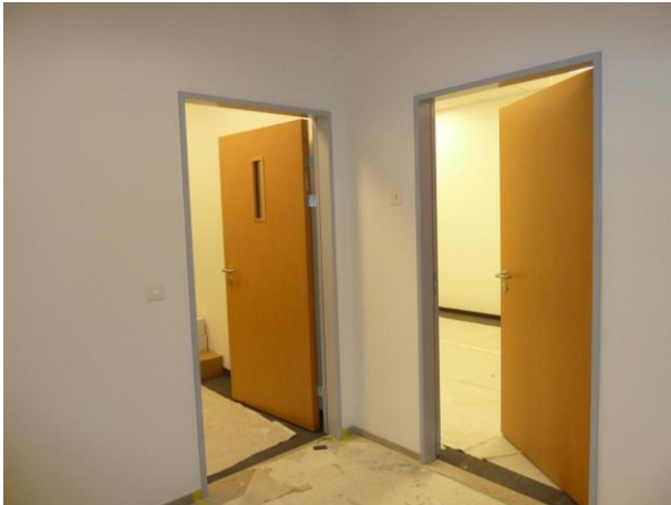
Die Innentüren sind montiert; hier zum Bischofschafts- und Sekretärszimmer.