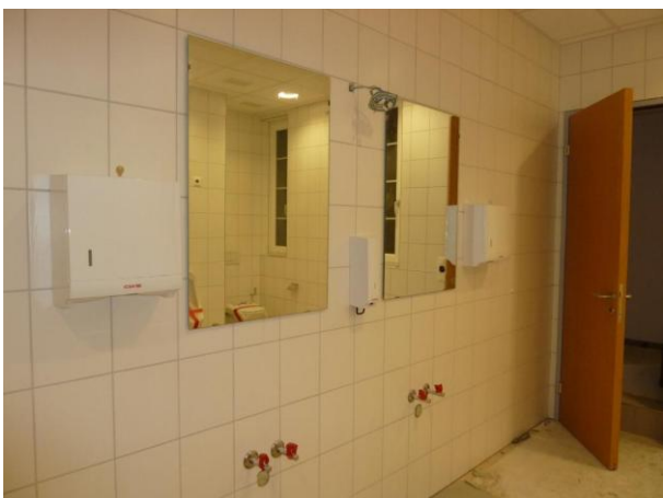
Montierte Spiegel sowie Papiertuch- und Seifenspenden im Herren-WC.