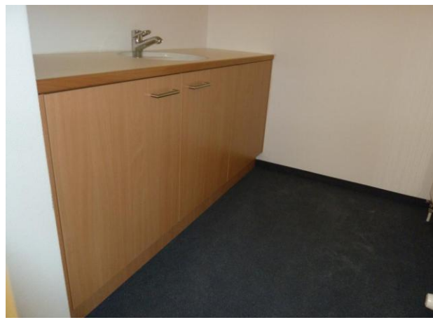
Alle Waschtische sind jetzt eingebaut; hier derjenige zur Vorbereitung des Abendmahls.