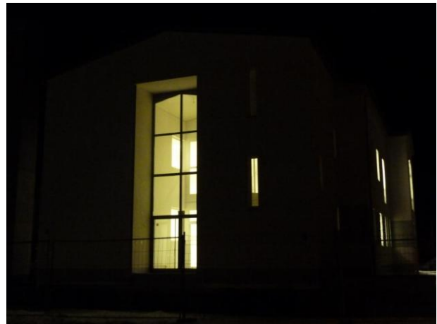
17. Februar 2012: Nächtliche Impression.