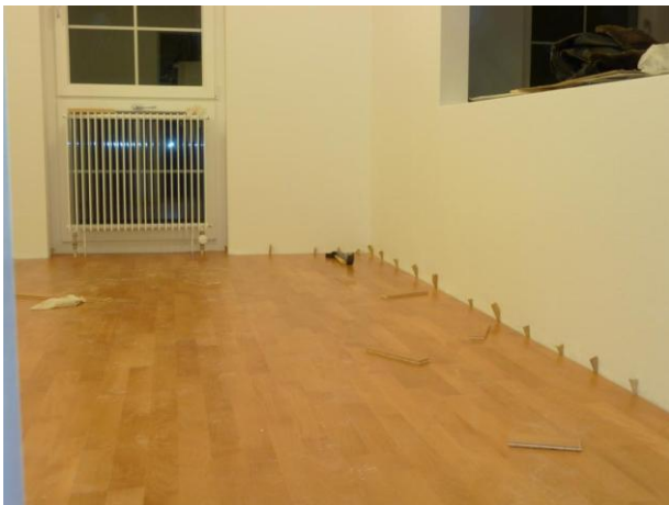
Hier die Partie im Bereich zur Durchreiche der Küche.