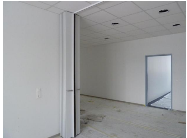
Die Falt- und Trennwände sind eingebaut, hier im EG im Bereich Taufbecken / PV-Zimmer...