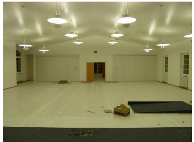
Blick vom Podium aus in die Kapelle mit geschlossenen Trennwänden. Auch das Podium ist jetzt mit Teppich verkleidet, der Parkett mit Folie geschützt.