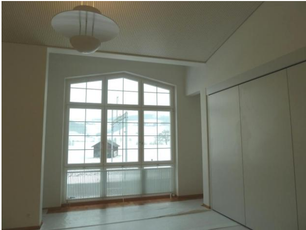
... wiederum mit Blick auf den verschneiten Isisberg.