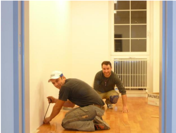
31. Januar 2012: Noch spätabends sind die Verlegearbeiten für den Parkett in der Kapelle und in den angrenzenden Gruppenräumen im Gang.