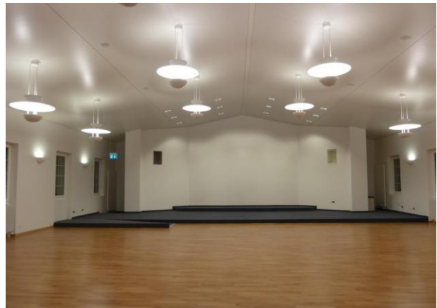
24. Februar 2012: Die Kapelle in praktisch fertigem Zustand; nur die Brüstung und einzelne technische Details fehlen noch.