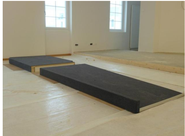
In der Kapelle entsteht die Rampe zum Podium.